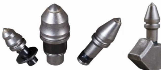
PUNTAS DE FRESADORA